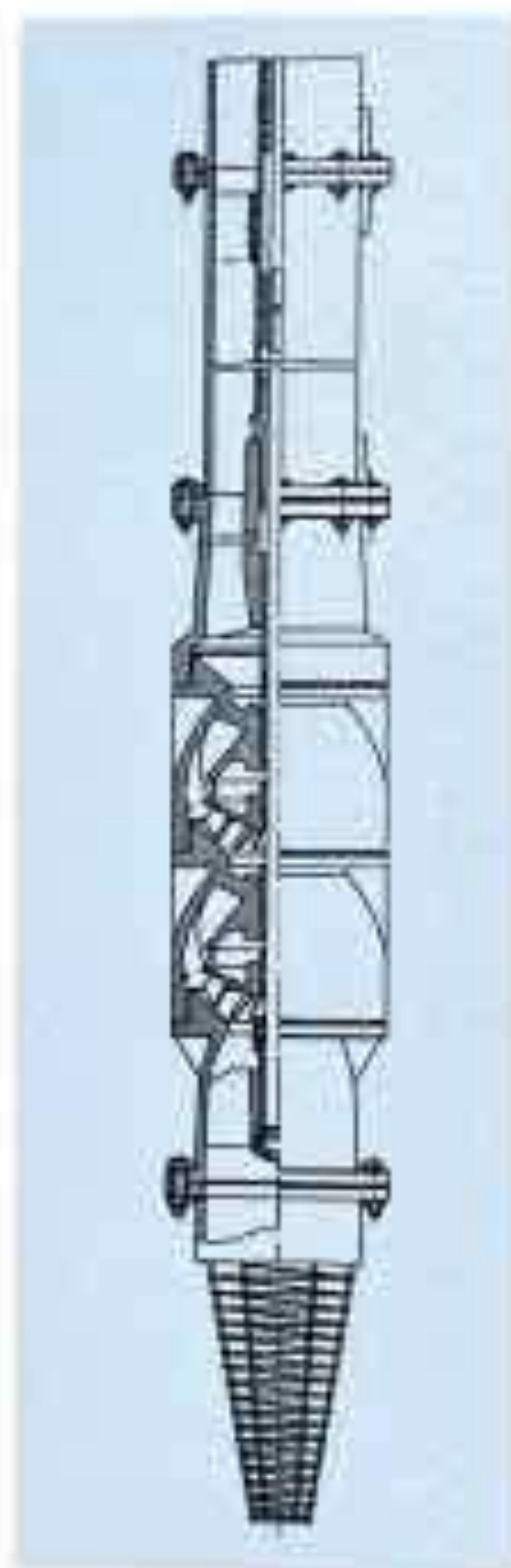
مقطع بریده توربین

از چند قسمت پوسته پمپ و پروانه و شافت ضد زنگ تشکیل شده که پروانه‌ها با پوش مخروطی روی شافت محکم گردیده و در شکل مقابل مشاهده می‌گردد.