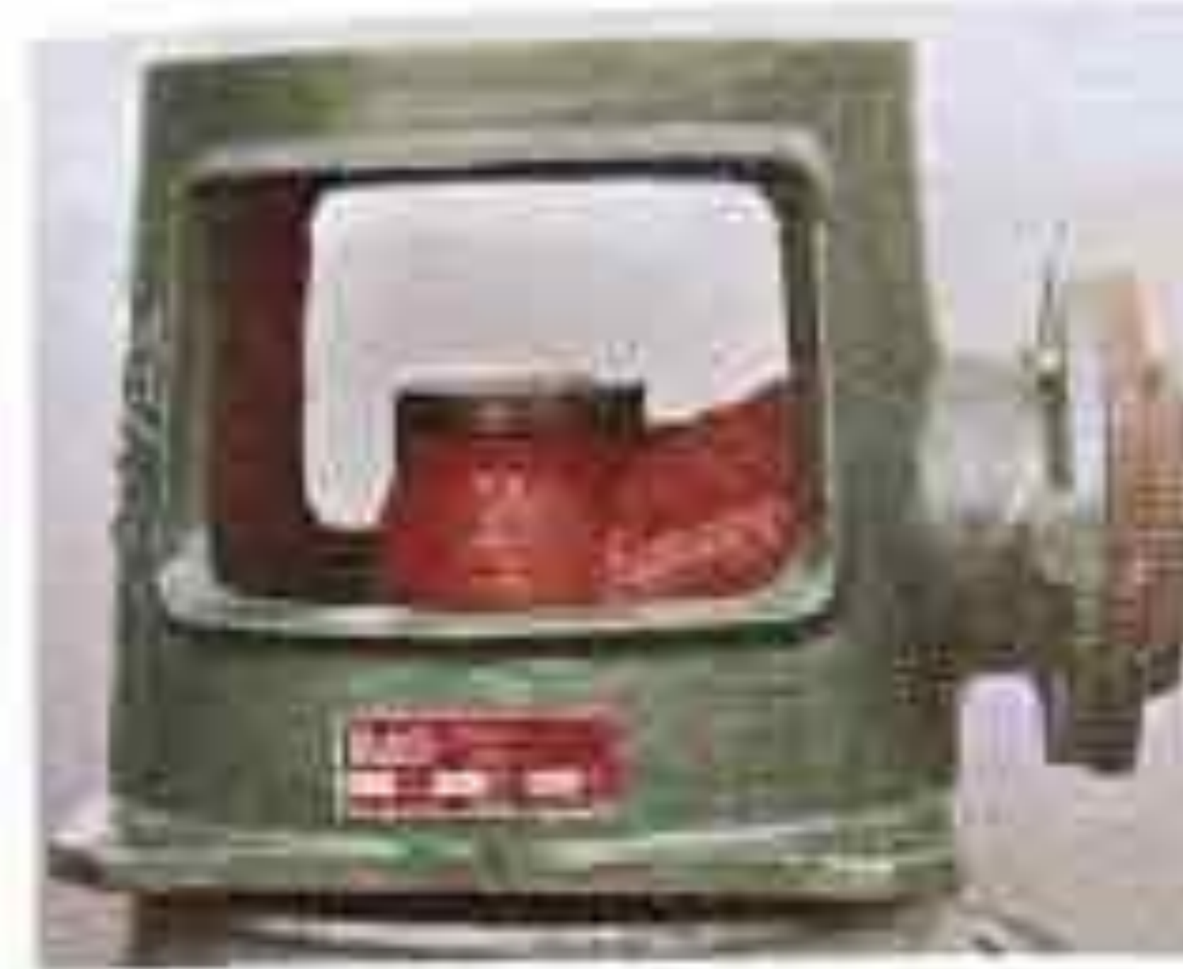
عکس هد پمپ

که از چدن مرغوب و دو دهانه گیرنده و دهنده تشکیل شده